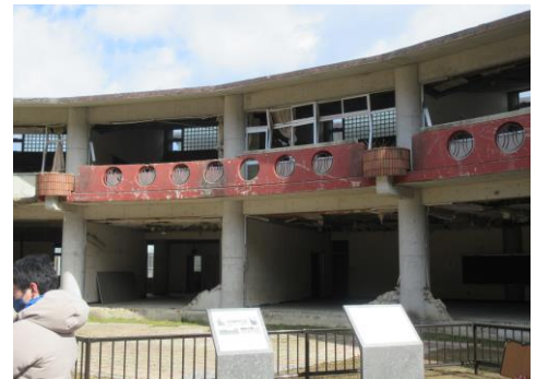
児童74人が犠牲になった大川小学校

8月8日には宮崎県日向灘を震源とする最大震度6弱の地震が発生し、その後、津波注意報も発表されました。さらには、この地震により、南海トラフ地震臨時情報が発表され、大地震が来るのではないかと緊張が日本列島に走りました。昨日9月1日は「防災の日」でした。この日が防災の日に制定されたのは、ご存知の通り、1923(大正12)年に発生した関東大震災がきっかけです。去年は、関東大震災から100年ということで、様々な防災関係のイベントが行われていました。