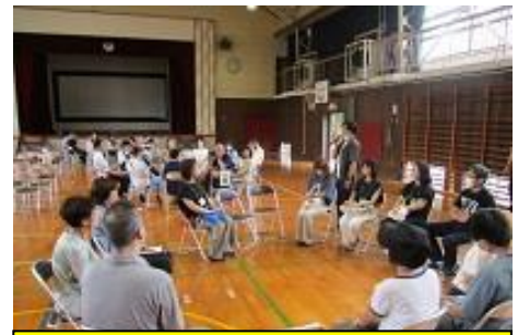
道徳授業後の保護者・地域の懇談会

今年度は創立 50 周年となる来年に向けて、コミュニティ・スクールのスタート、運動会、ほたる祭り等の行事、地域や関係機関の教育力を活用した 3,4年生を対象にしたリコーダーミニコンサート、2~4年生を対象にした「ロバの音楽座」コンサートはじめ、グローバル教育プロジェクトを積極的に進め、体験や人とのふれあいを大切にしたい心に届く学びを取り入れて、子供たちはいきいきと前期前半を終えることができました。ご理解・ご協力をいただきました保護者・地域の皆様、またご尽力いただきました皆様に改めて感謝申し上げます。