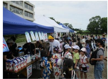
この日は大人も子供も笑顔でいっぱい